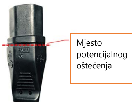
Slika 1 Mjesto potencijalnog oštećenja

Željeli bismo naglasiti da su zahvaćeni kablovi i dalje u potpunosti u skladu sa svim važećim standardima za električne i medicinske proizvode.